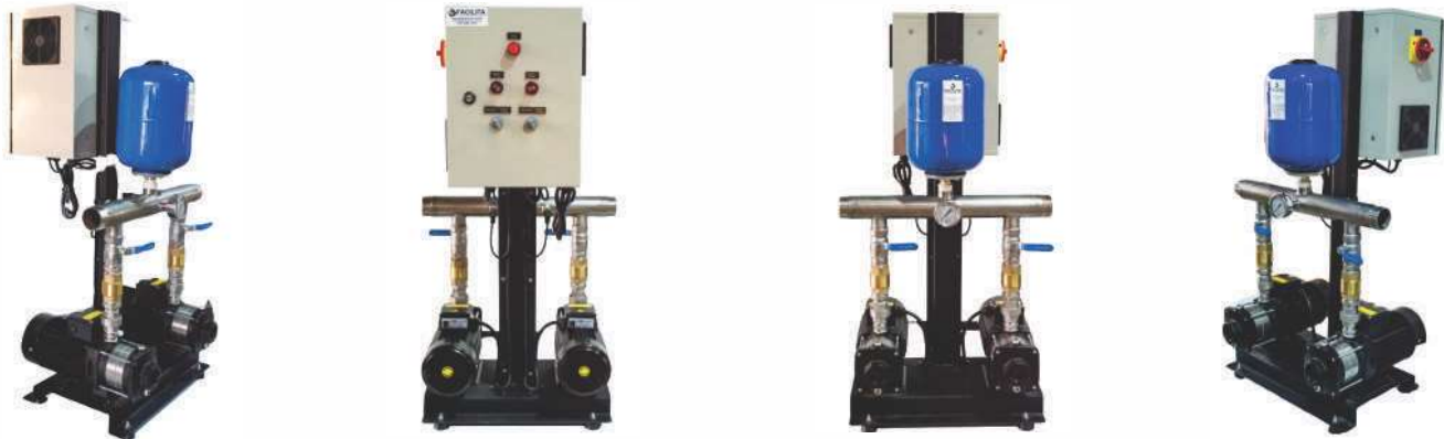
TABELA DE SELEÇÃO BOOSTER - MCH2R

O sistema de pressurização MCH-2R é composto por duas bombas multi estágio horizontal silenciosa e controlada por dois inversores de frequência de fabricação nacional, com funcionamento alternado (Principal e Reserva) para se ter uma pressão constante em todas as saídas que liga e desliga a bomba conforme a necessidade do consumo no momento. Ele pode ser utilizado para o bombeamento de baixo para cima ou de cima para baixo e sendo indicado para aplicações residenciais, comerciais e industriais.